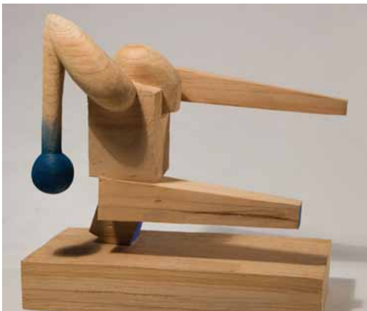
Marcha - 2016 talla en madera, pintada 27,5 x 29,5 x 16 cm.