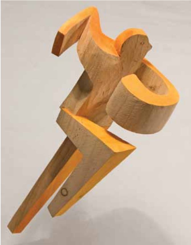
Corredor I - 2016 talla en madera, pintada 47 x 20 x 17 cm.