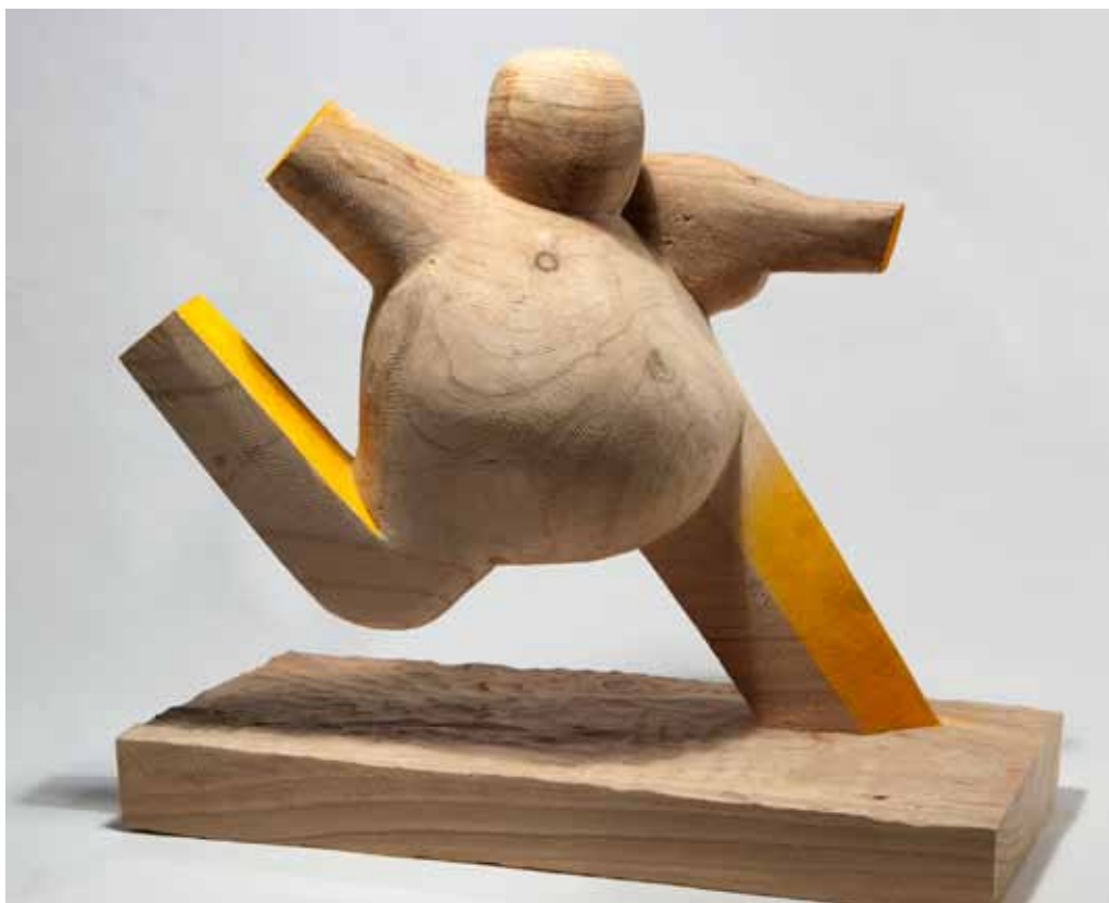
Gigante - 2016 talla en madera, pintada 35,5 x 40,5 x 19,5 cm.