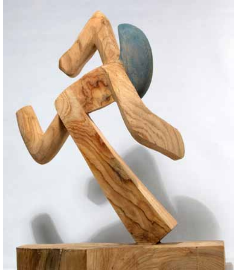
Betametasona - 2016 talla en madera, pintada 45 x 35 x 15 cm.