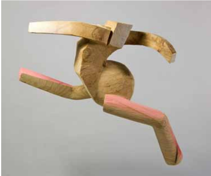
Adrenalina - 2016 talla en madera, pintada 24,5 x 39,5 x 14,5 cm.