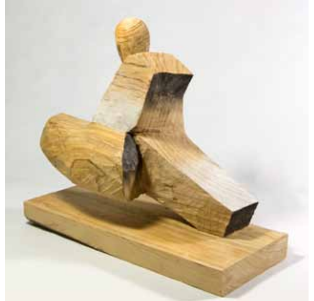
Endorfina - 2016 talla en madera, pintada 32,5 x 38 x 15,5 cm.