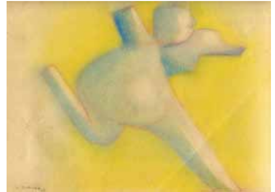
Dibujo - 1989 Pastel