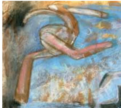
Dibujo - 1989 Témpera y Pastel