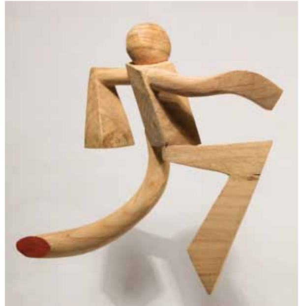
Contractura - 2016 talla en madera, pintada 34 x 36,5 x 16 cm.