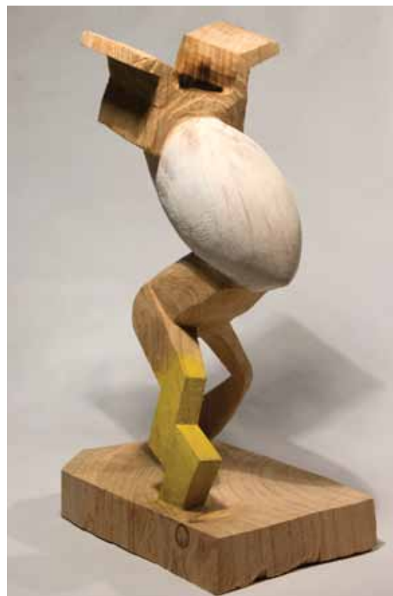
Little patriot- 2016 talla en madera, pintada 38 x 22 x 15 cm