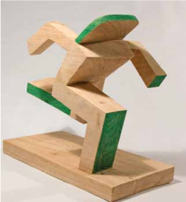
Corredor verde - 2016 talla en madera, pintada 34,5 x 38 x 18 cm.